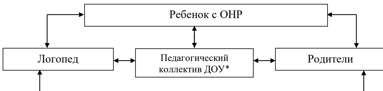
Модель взаимодействия субъектов коррекционно-образовательного процесса в группе для детей с общим недоразвитием речи

Рациональная организация совместной деятельности помогает правильно использовать кадровый потенциал, рабочее время, определять основные направления коррекционно-развивающей работы и умело реализовывать личностно-ориентированные формы общения с детьми.